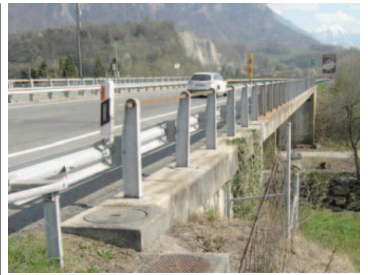
Les ponts de l'autoroute A9, situés au-dessus de l'Avançon près de Bex, ont besoin d'être assainis. CP

Dans l'étude M.I.S Trend, commandée par Swiss Wine promotion début 2013, s'agissant de notoriété spontanée, les vins du Valais arrivent nettement en tête (99% des sondés les connaissent). Dôle et fendant sont connus par 94% des personnes interrogées (en comparaison, la petite arvine par seulement 49% du public et le cornalin 38%), mais pourtant les ventes de la dôle sont en baisse. Dur, dur... ○