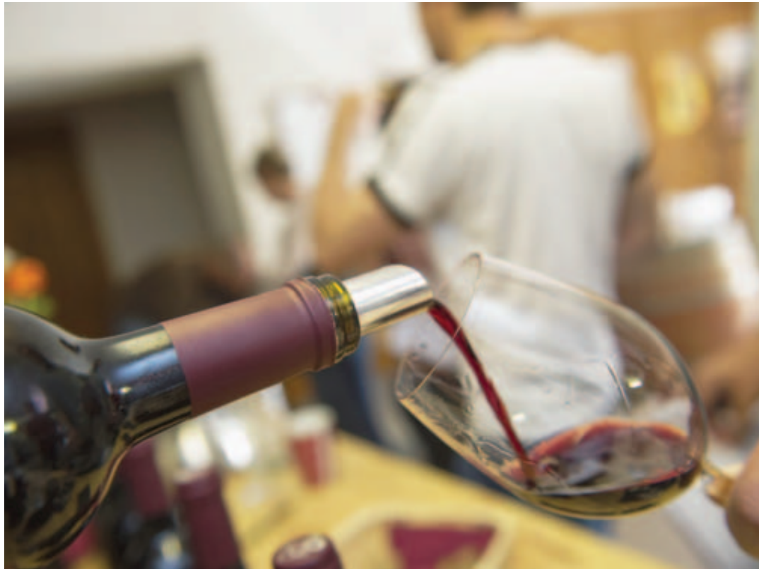
Même si la dôle est connue de 94% des Suisses, elle peine à se vendre.

Le mot dôle reste exclusivement réservé à un assemblage de 85% de pinot noir-gamay avec une dominante pinot et une autorisation d'ajouter 15% de spécialités.